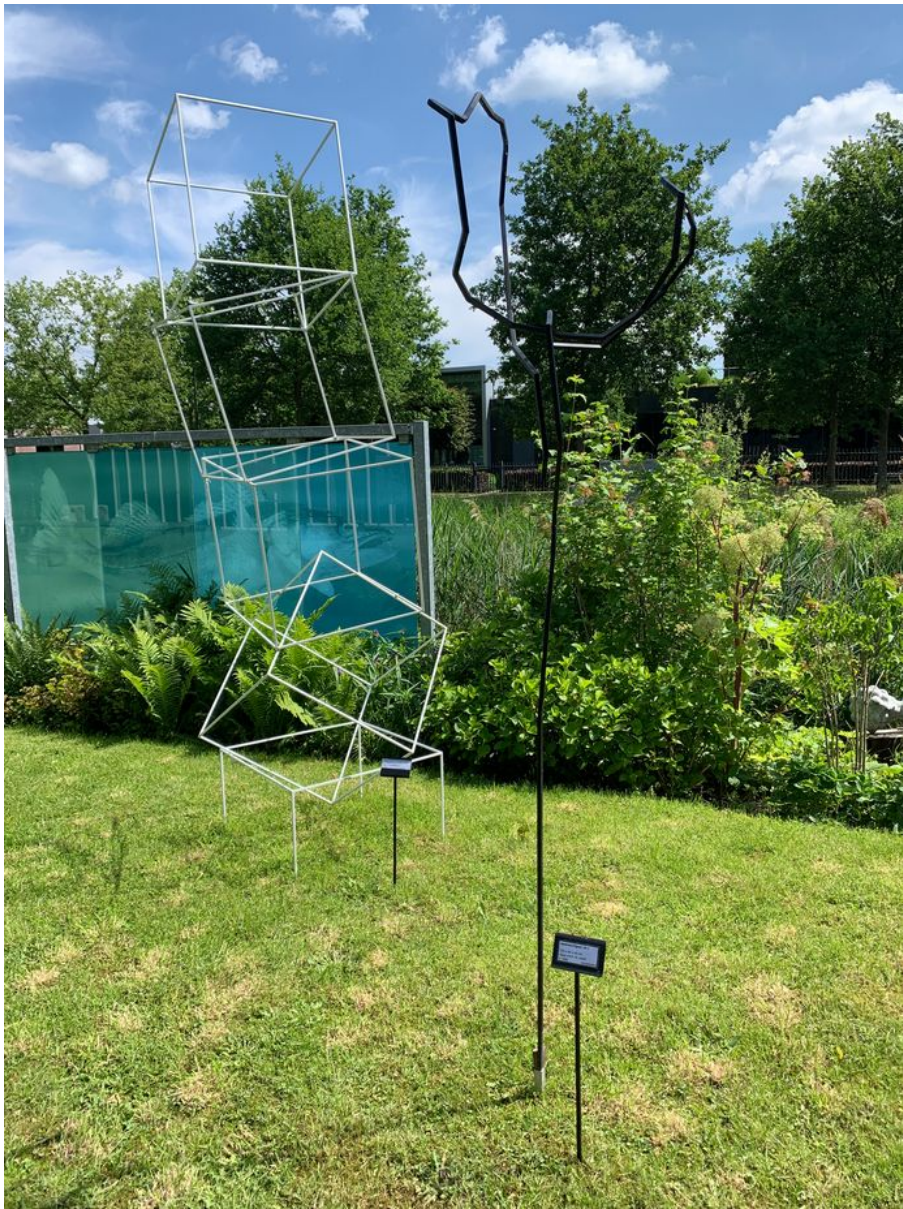
Werk van Jan Snep in de beeldentuin van Ellen Brouwers.