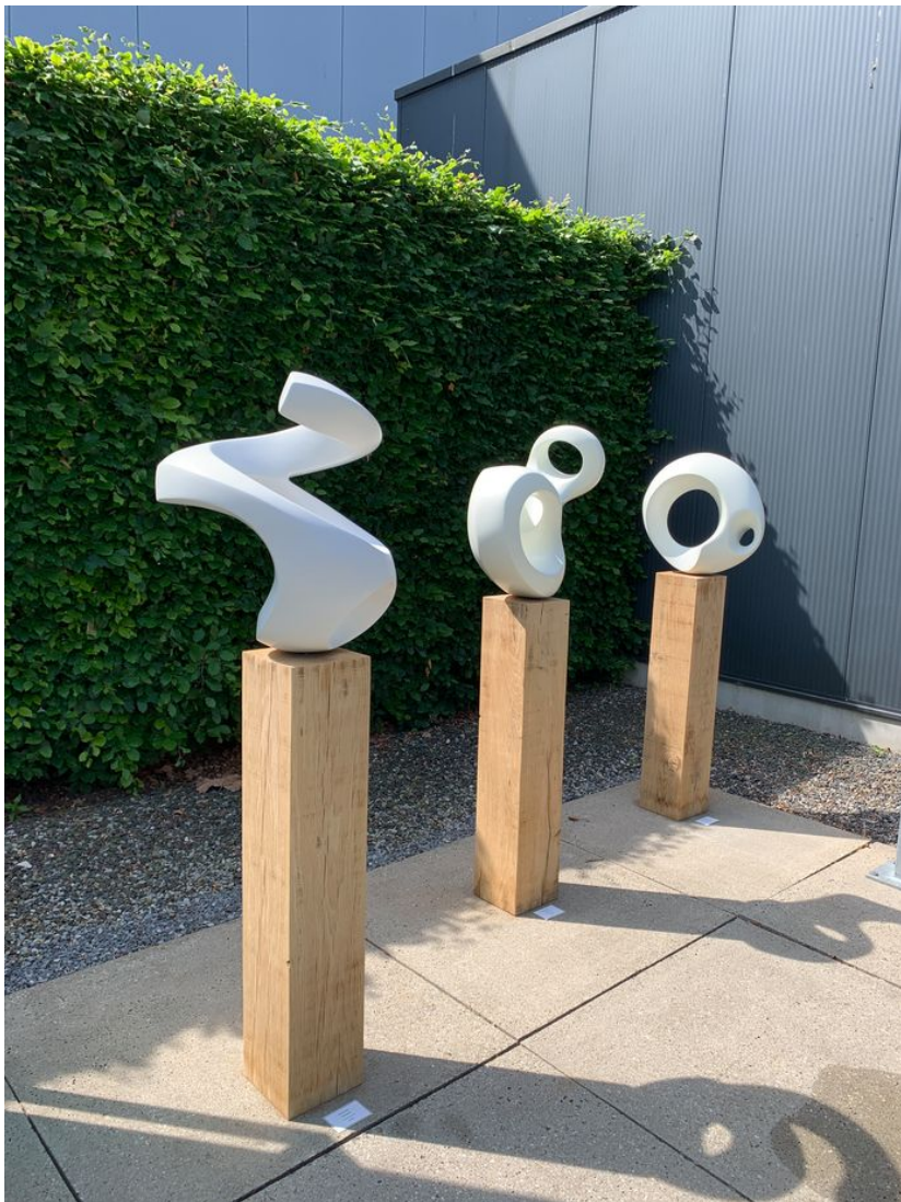
Werk van Monique Lipsch in de beeldentuin van Ellen Brouwers.